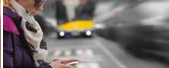
Geef uw mening over ons nieuwe mobiliteitsplan (p. 3)