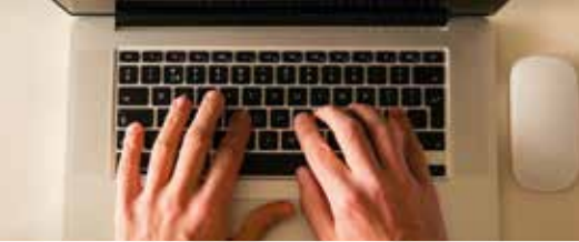
Digitalisering in Grimbergen (p. 2)