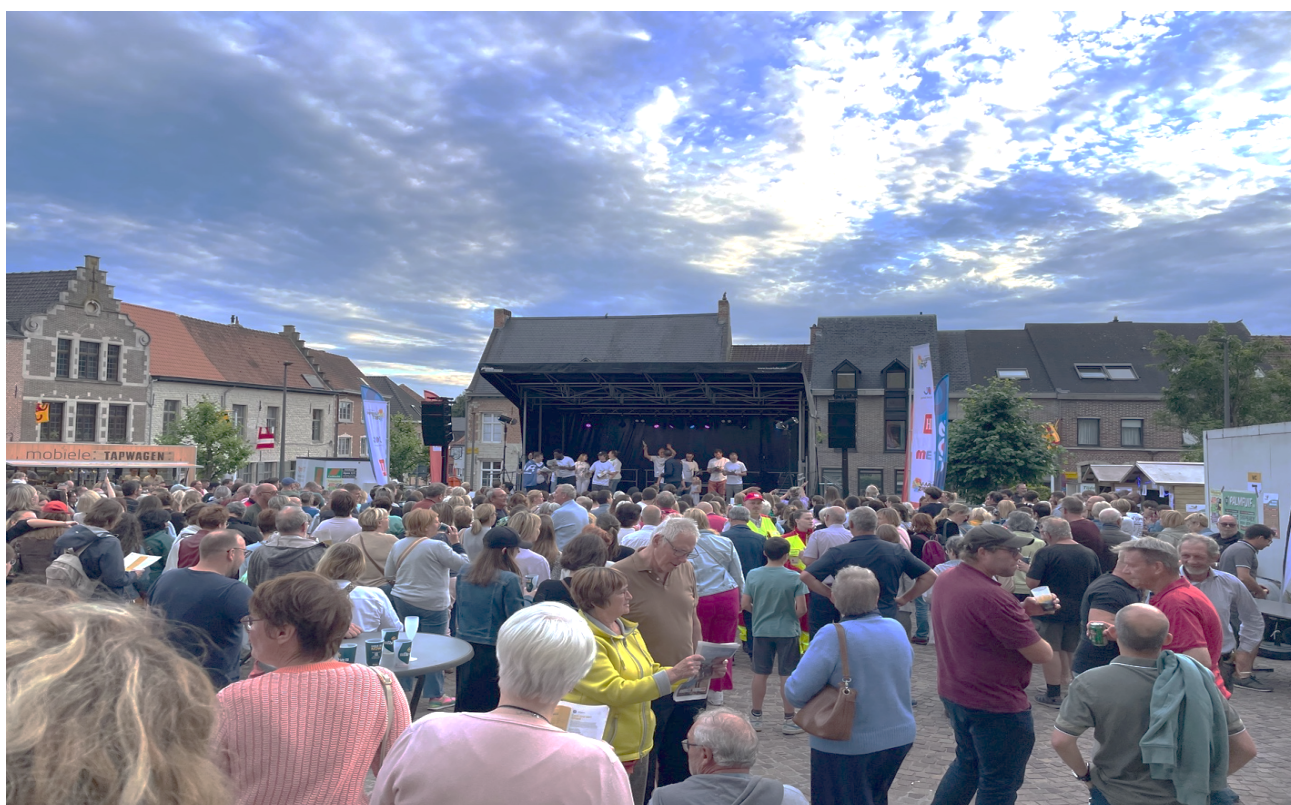
'Vlaanderen zingt' in Grimbergen

Daarnaast blijven we investeren in het vieren van onze Vlaamse feestdag met topevenementen zoals het 'Smaakfestival' en het gezellige 'Vlaanderen Zingt'. Deze evenementen brengen niet alleen mensen samen om te genieten van culinaire hoogstandjes en muziek, maar ze dragen ook bij aan het versterken van de banden tussen de inwoners van Grimbergen en het bevorderen van een gevoel van trots en verbondenheid met onze Vlaamse cultuur en identiteit.