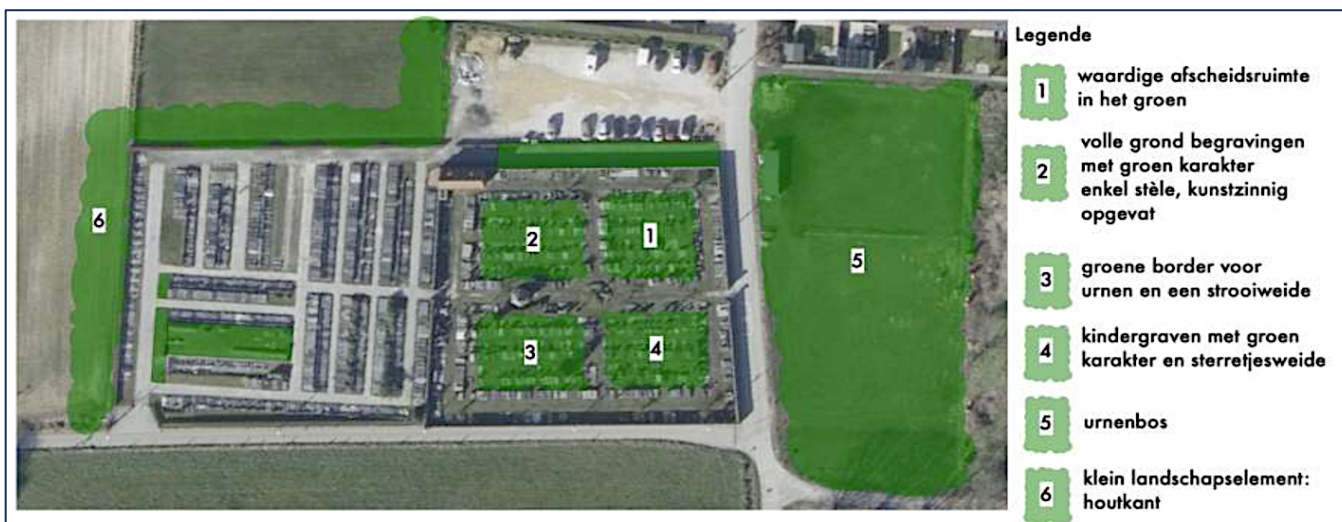
Mogelijke opwaardering van de begraafplaats Humbeek met o.a. een urnenbos

Straten met een gewijzigde verkeerssituatie krijgen een groene invulling, waarbij we de kaart van ontharding en vergroening maximaal uitspelen.