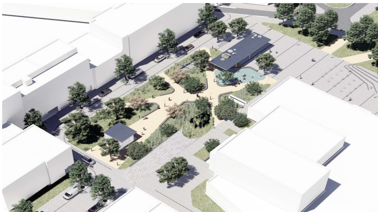
Voorontwerp van het nieuwe Gemeenteplein

Een centrale ontmoetingsplek in Strombeek-Bever is het Gemeenteplein . We realiseren dan ook de herinrichting van deze plek met méér groen, waardoor ze aangename ontmoetingsplekken worden voor alle inwoners. Het Gemeenteplein kan dan via een groene verbindingsas verbonden worden met het Sint-Amandsplein wat tevens bijkomend vergroend dient te worden.