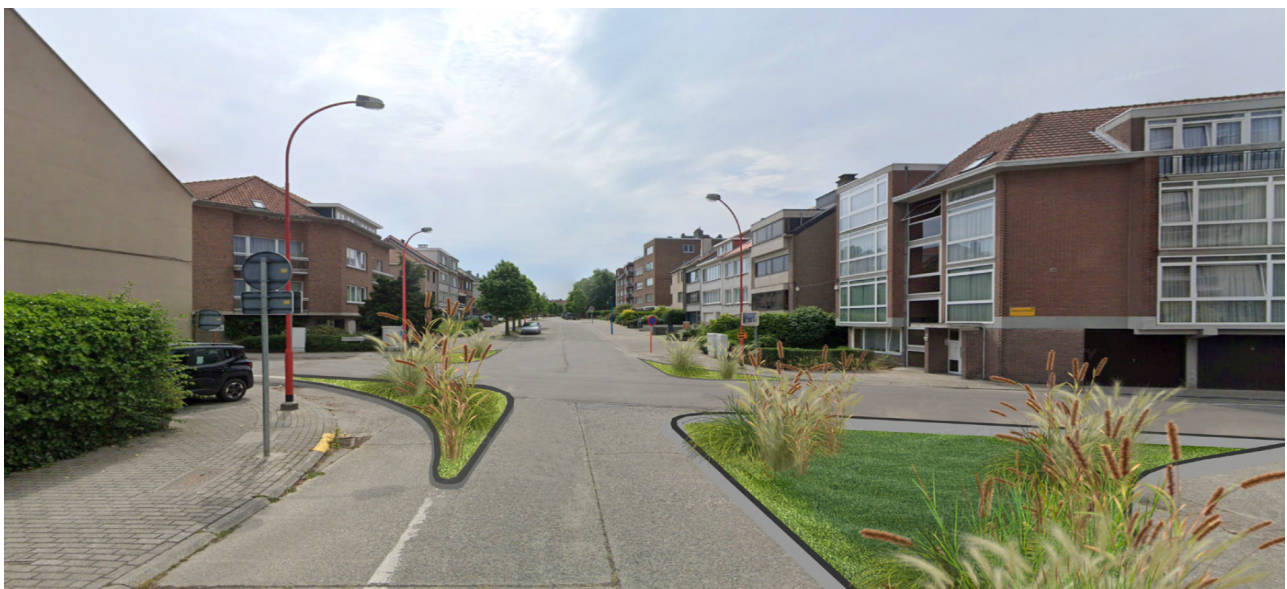
Voorbeeld van ontharding op kruispunten (Grote Winkellaan-Koningslosesteenweg)