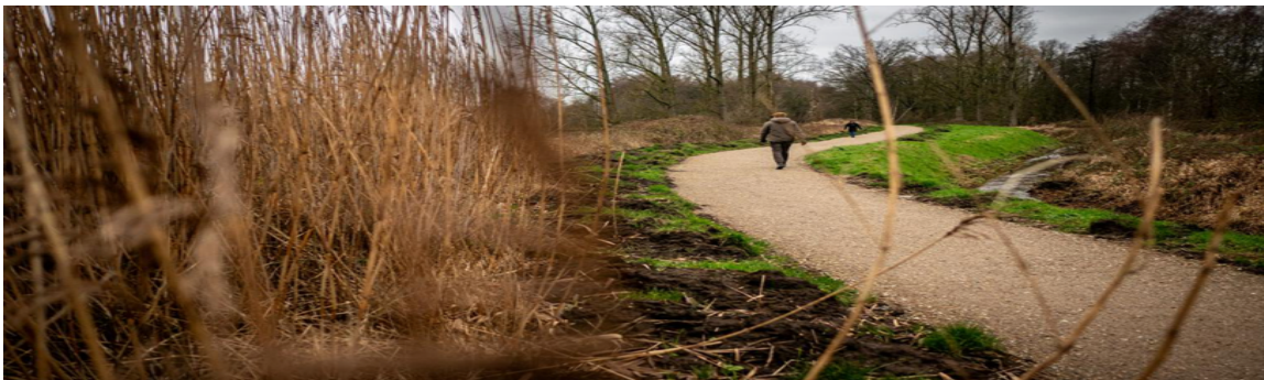
Opwaardering trage weg

Daarnaast voert het bestuur een beleid om op deze premiumlocaties horeca en andere detailhandel te ondersteunen waar nodig.