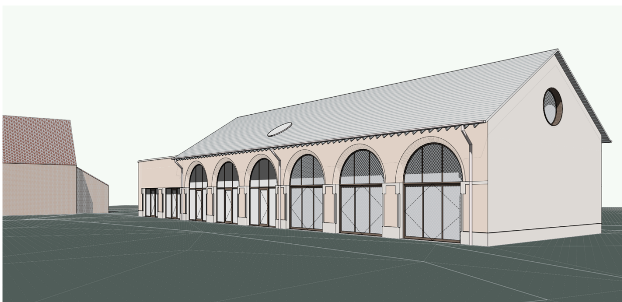
Voorontwerp renovatie achterste vleugel Charleroyhoeve

te bieden, ondersteunen we de academische ontwikkeling van onze jeugd en bieden we hen de kans om hun potentieel te bereiken.