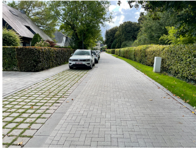
Realisatie Guldendal als modelvoorbeeld in Grimbergen

Door middel van deze maatregelen streven we ernaar om een veilige en vlotte mobiliteit te garanderen voor al onze weggebruikers, en om van Grimbergen een aangename en leefbare gemeente te maken om te wonen en te bewegen.