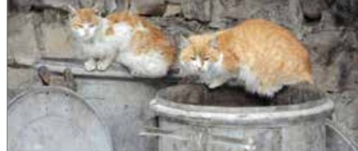
Gebrek aan zwerfkattenbeleid p. 3