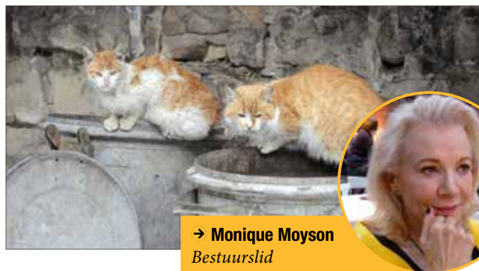
→ Monique Moyson Bestuurslid