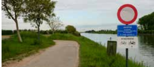
Oostvaardijk wordt sluij(snel)weg p. 2