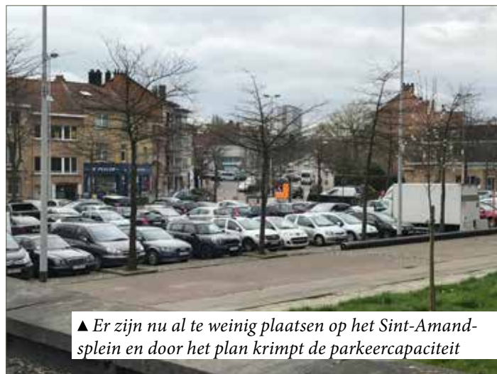
▲ Er zijn nu al te weinig plaatsen op het Sint-Amandsplein en door het plan krimpt de parkeer capaciteit